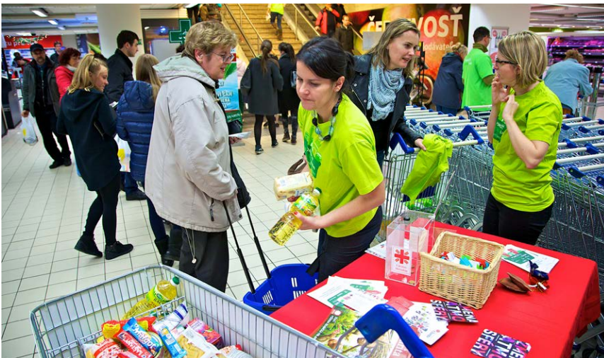
Tento rok do zbierky najviac prispeli zákazníci hypermarketu v Dubnici nad Váhom, Obchodného domu MY na Kamennom námestí v Bratislave (na fotografii) a hypermarketu v Brezne.

Potravinová zbierka prebiehala od 16. do 21. novembra 2015 v 78 obchodoch Tesco po celom Slovensku. Ľudia najviac darovali múku, cestoviny, cukor, soľ, strukoviny, ryžu, ale aj tekuté mydlá. Zbierku spoluorganizovali Slovenská katolícka charita, organizácia Depaul Slovensko, Potravinová banka Slovenska a tento rok po prvý raz aj Evanjelická Diakonia. Formou sociálneho marketingu sa do zbierky zapojila aj spoločnosť Unilever. «