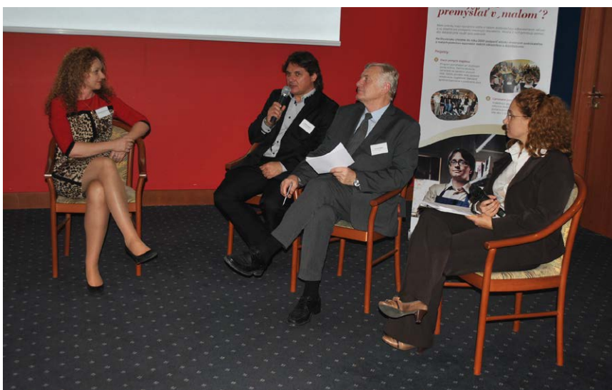
Pivovary Topvar spoluorganizovali konferenciu týkajúcu sa potenciálu rozvoja cestovného ruchu v Prešovskom kraji v rámci spustenia nového ročníka grantového programu Šariš ľuďom.

Pivovary Topvar v spolupráci s Komunitnou nadáciou Veľký Šariš v októbri 2015 vyhlásili ďalší ročník komunitného grantového programu Šariš ľuďom. Na projekty, ktoré v pre-