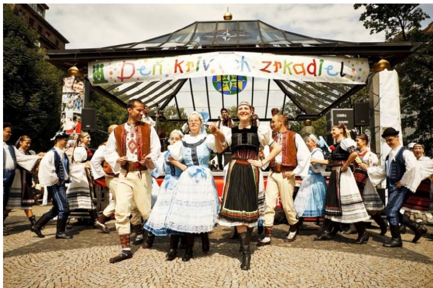
Nadácia Veolia každoročne podporuje aj Deň krivých zrkadiel, ktorý pod heslom „Sme iní, nie horší. Dovoľte nám žiť s vami, nie vedľa vás...“ organizuje Združenie na pomoc ľuďom s mentálnym postihnutím v SR.

Po deviatich rokoch pôsobenia zmenila Nadácia Dalkia Slovensko svoje meno. Od 7. októbra 2015 vykonáva svoju činnosť pod novým názvom – Nadácia Veolia Slovensko . Ide o poslednú zmenu názvu v skupine Veolia Energia na Slovensku, ktorá nastala v rámci začlenenia medzinárodných aktivít skupiny Dalkia pod skupinu Veolia.