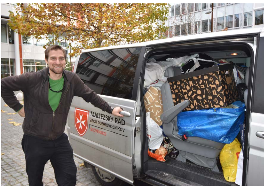
Z Bratislavy si odvážal Domov sv. Jána z Boha plné auto vyzbieraných darov.

Slovenské elektrárne sa opäť zapojili do veľkej Engage zbierky. Desiatky zamestnancov po celom Slovensku sa rozhodli prispieť a v rámci Jesennej zbierky pre ľudí v núdzi vyzbierali oblečenie, obuv, čistiace potreby, drogériu, ale napríklad aj televízor, kolieskové korčule alebo bicykle. Výnimkou neboli ani riaditelia, ktorí venovali celú knižku stravných lístkov. Firma so svojimi zamestnancami tak prejavila spolupatričnosť voči tým, ktorí sú odkázaní na pomoc druhých. «